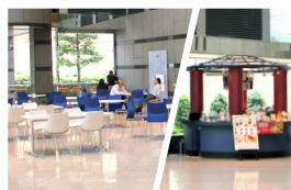
フリーカフェスペース