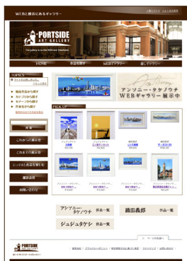
ポートサイドアートギャラリー HP